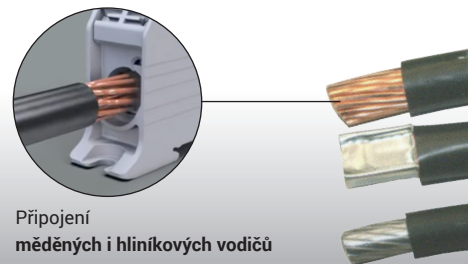
Připojení měděných i hliníkových vodičů