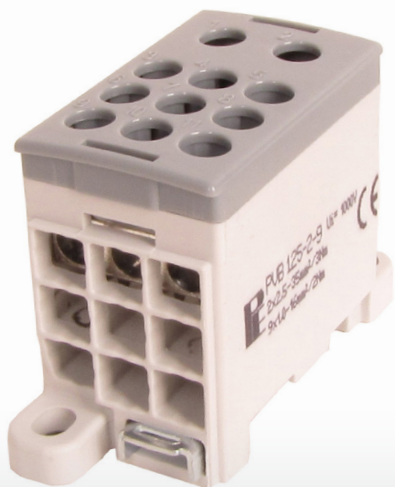
PVB 125-2-9 Vstupy