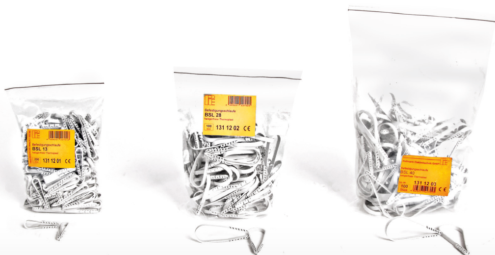
Pásové hmoždinky - BSL